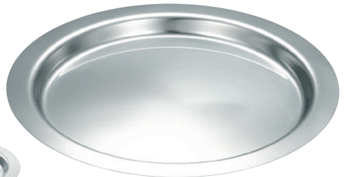
深型ボール フラットエッジ トレー